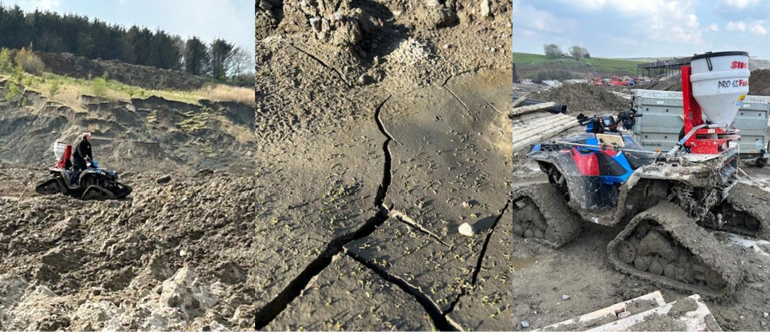
Græssåning i skredet